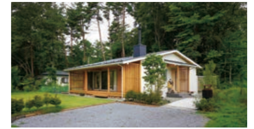
移住事例／御代田町 3人家族