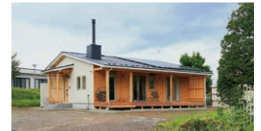
移住事例／上田市 3人家族