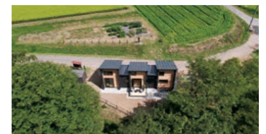
二拠点居住／上田市 (SENKO TINY CAMP) →P074にも掲載