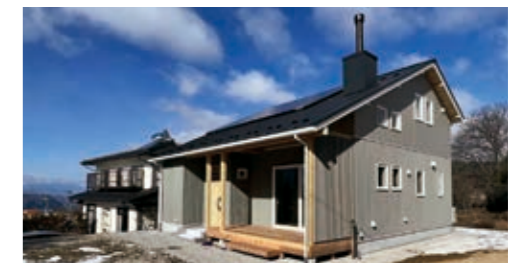
移住事例／小諸市 2人家族